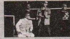
'ತಿಂಡಿಗೆ ಬಂದ ತುಂಡೇರಾಯ' ನಾಟಕ ಪ್ರದರ್ಶನ ನಡೆಯಿತು.